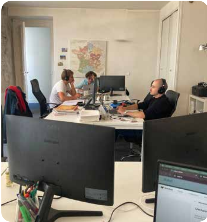
Les bureaux de l'asso PRIXM-Bernardins