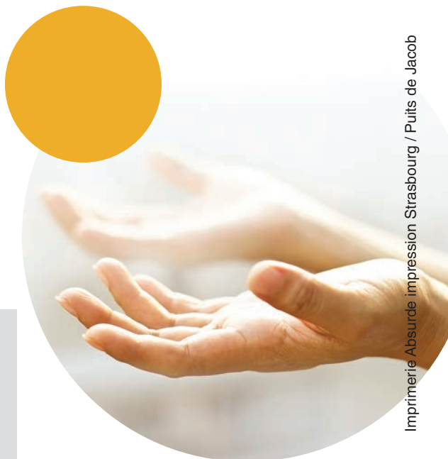
Imprimerie Absurde impression Strasbourg / Puits de Jacob