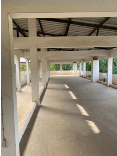
Deuxième étage du Centre Médical en l'état actuel

L'agrandissement du Laboratoire n'est qu'une facette d'un projet plus large : Le Projet Hépatites .