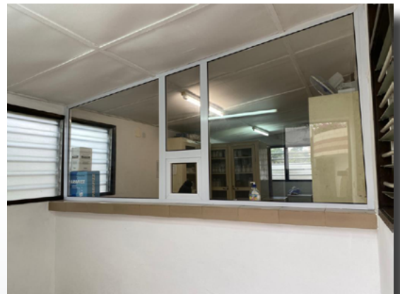
Le guichet du dépôt pharmaceutique