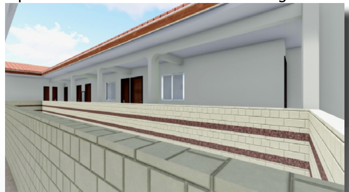
Projet du Futur Laboratoire

Le dépistage et la vaccination, une seconde facette du projet , s'articulent avec la prévention. En somme, l'idée est de constituer une équipe (un médecin, un infirmier préleveur, un préventeur) munie d'un véhicule tout terrain qui dans un premier temps, consulte, prélève et forme. Puis dans un second temps vaccine ou traite les cas échéants.