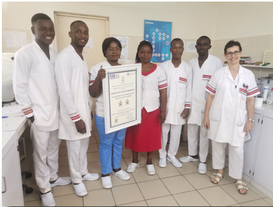
L'équipe du Laboratoire