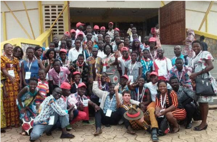
Forum National du Renouveau Charismatique des Jeunes du Togo