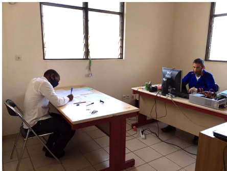
Le candidat et le surveillant

Et le mercredi 23 septembre entre 14h et 16h, il était présent, tout sourire sous son cache-nez (nom que les Togolais donnent au masque chirurgical) pour composer.