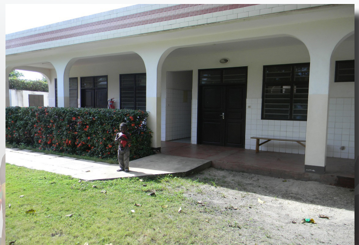
Les nouvelles rampes d'accès en pente douce