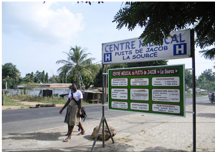
Grand panneau d'informations