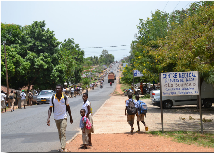
La route principale du Sud vers le Nord du Togo longe le Centre Médical