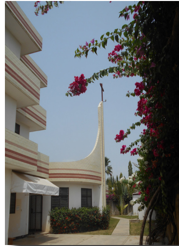
Le Centre et la Chapelle